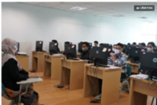
Peserta sedang melakukan uji UTBK SNBT 2023 di Pusat UTBK yang ada di Universitas Negeri Jakarta (UNJ), pada Senin (8/5/2023).

https://www.kompas.com/edu/read/2023/05/08/163350671/43388-orang-pilih-unj-di-ajang-utbk-snbt-2023?page=all