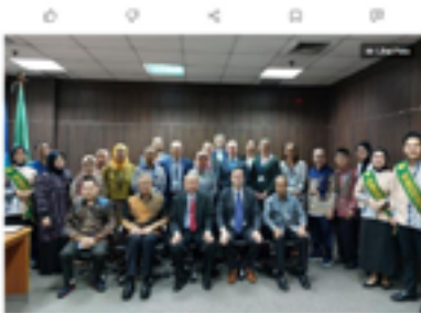
Delegasi dari Finlandia dan UNJ berdiskusi tentang kerja sama di bidang pendidikan di Gedung Sate pada Rabu, 30 Mei 2023.

https://www.kompas.com/edu/read/2023/05/30/220728171/delegasi-finlandia-dan-unj-dorong-kerja-sama-bidang-pendidikan