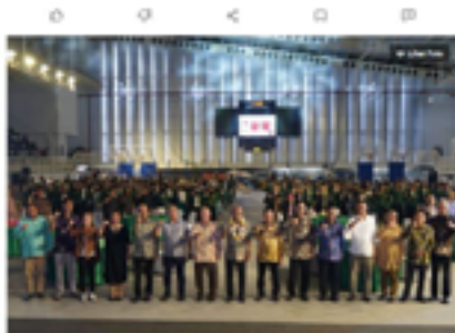
Bedah buku dan diskusi publik 'Aldera dan Catatan Peran UNJ dalam Perjuangan Demokrasi 1993-1999' yang digelar di Gedung Sate pada Rabu, 10 Mei 2023.

https://www.kompas.com/edu/read/2023/05/10/174850571/bedah-buku-aldera-dan-catatan-peran-unj-dalam-perjuangan-demokrasi-1993-1999