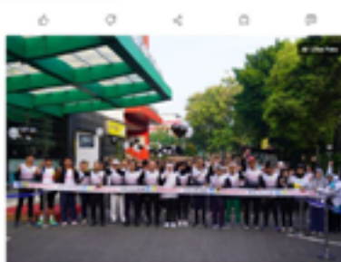
Lebih 1.200 sivitas UNJ semarakkan Bulan Merdeka Belajar lewat "Jalan Santai" yang digelar di Gedung Sate pada Rabu, 14 Mei 2023. (Kompas.com)

https://www.kompas.com/edu/read/2023/05/14/182719071/lebih-1200-sivitas-unj-semarakkan-bulan-merdeka-belajar-lewat-jalan-santai?page=all