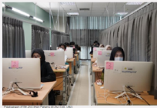
Peserta dalam UTBK 2023 Hari Pertama di UNJ

Puti Aini Kusumadewi - Senin, 08 Mei 2023 - 11:24:08 WIB