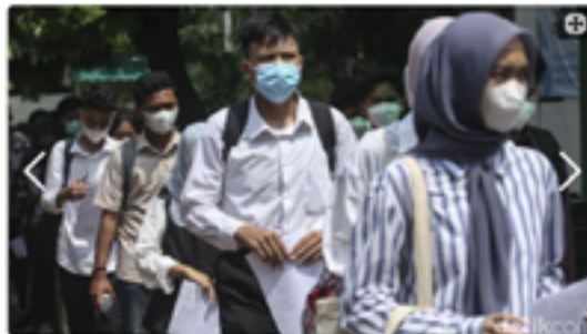
Dejumlah peserta Ujian Tulis Berbasis Komputer (UTBK) antra untuk memasuki ruangan ujian di Universitas Negeri Jakarta, Senin (8/5/2023).

Jakarta - Universitas Negeri Jakarta (UNJ) jadi salah satu lokasi penyelenggaraan Ujian Tulis Berbasis Komputer (UTBK). Sejumlah upaya dilakukan untuk cegah kecurangan.